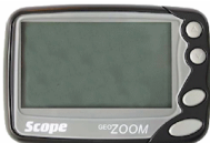
Illustration 3 : pager - PR