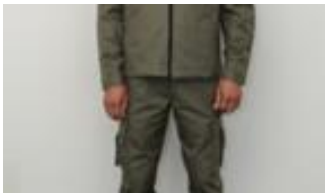
Illustration 9 : port de la veste sur le pantalon