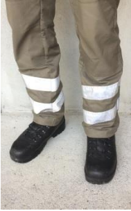
Illustration 7 : port du bas de pantalon