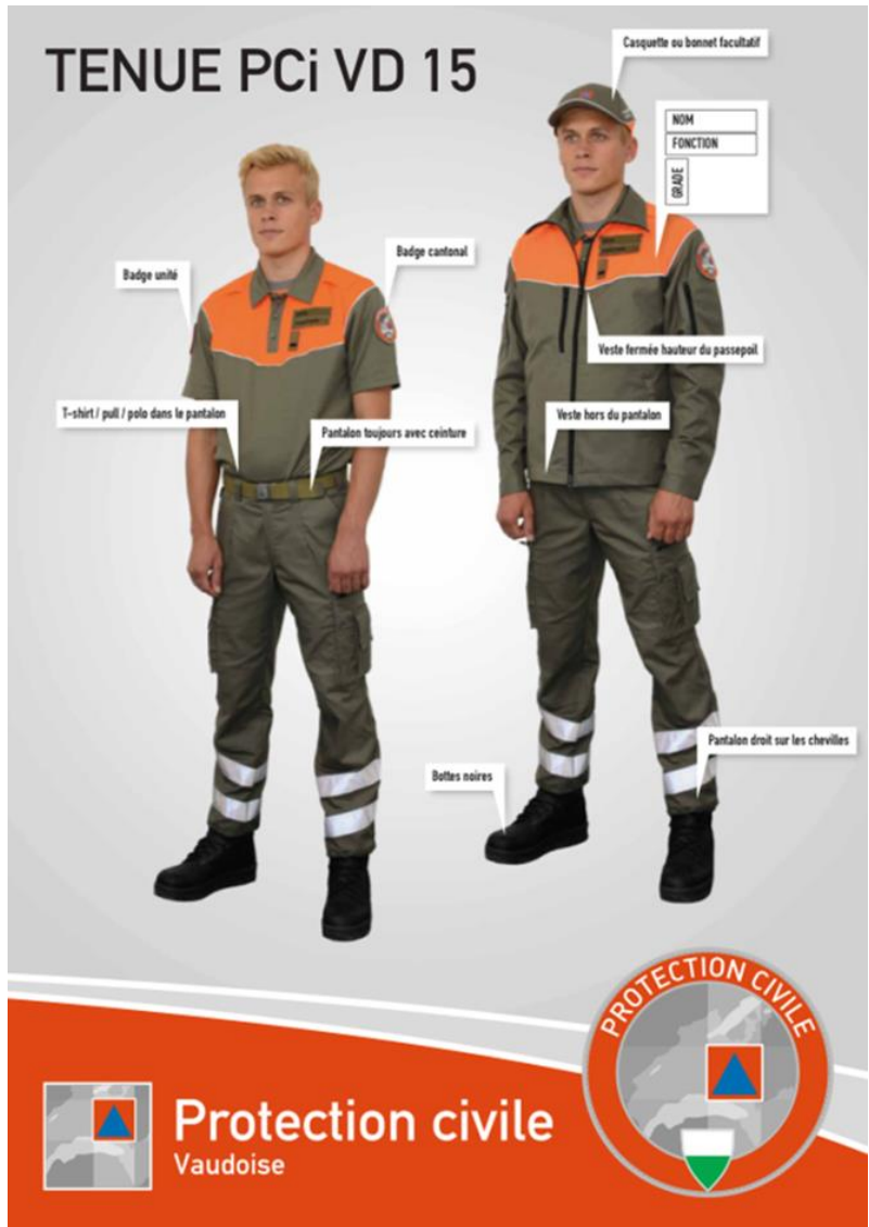
Illustration 5 : port de la tenue PCi VD 15