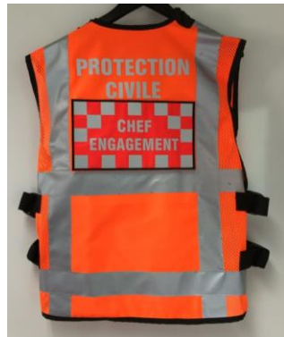
Illustration 14 : gilet face arrière