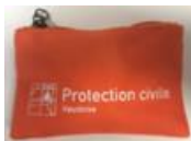
Illustration 2 : pharmacie de poche - PDP