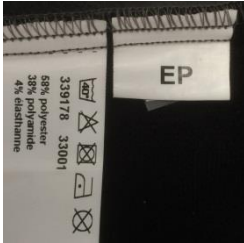
Illustration 4 : étiquette « EP »

Les pièces d'équipement inscrites au livret de service sont considérées comme équipement personnel « EP » de l'astreint. Ces pièces sont identifiables au moyen d'une étiquette cousue dans la couture intérieure du vêtement.