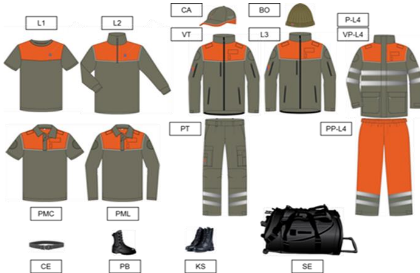
Illustration 1 : pièces d'équipement de la tenue PCi VD 15

La tenue PCi VD 15 est conçue selon un système de couches. Elle comprend les pièces d'équipement suivantes :