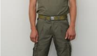
Illustration 8 : port du pull dans le pantalon