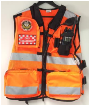
Illustration 13 : gilet face avant