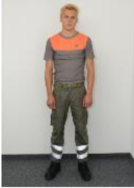
Illustration 6 : tenue base